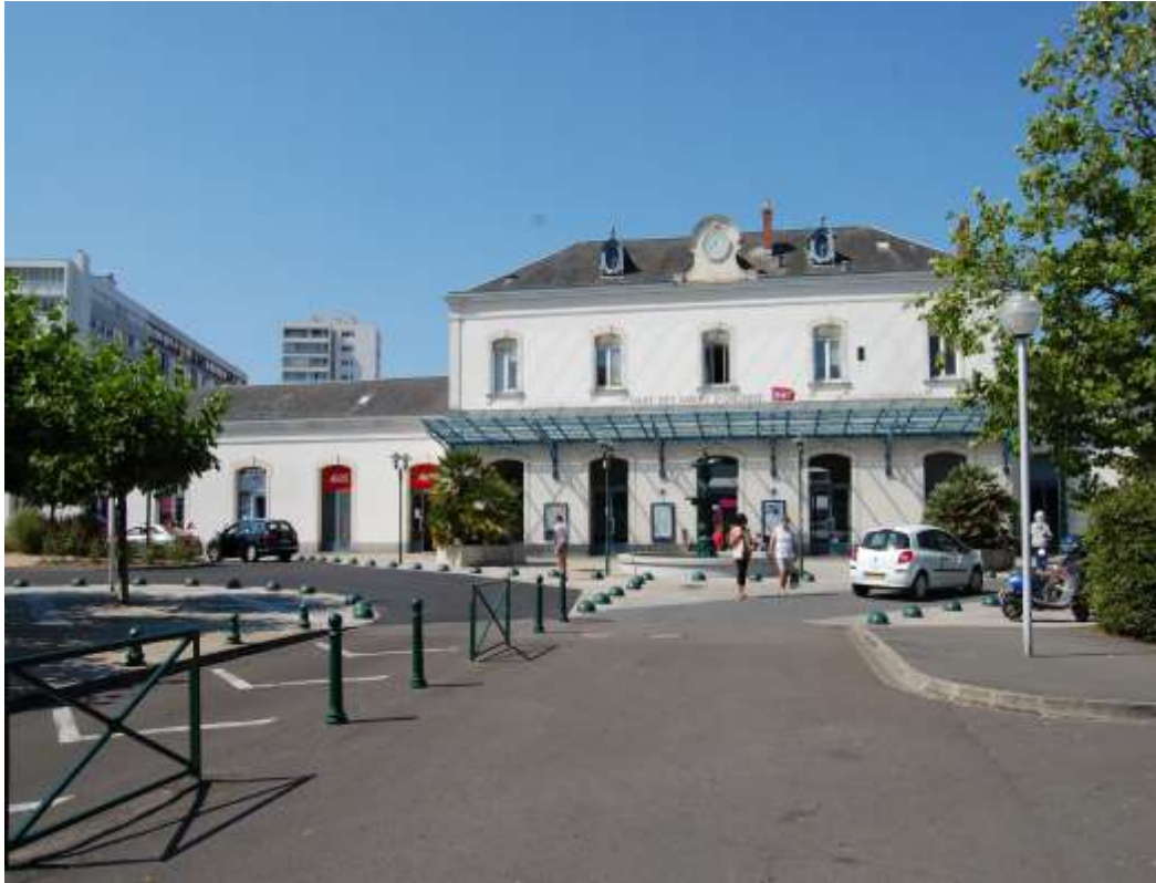
Gare des Sables d'Olonne

PROJET de PEM en cours d'étude de faisabilité jusqu'à fin 2024 - périmètre :